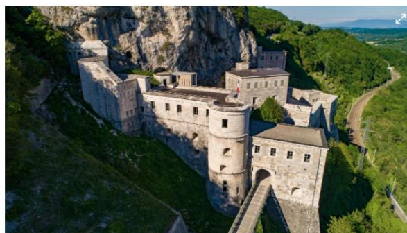
LeFort l'Ecluse a séduit les artistes.

C'est un nouveau rendez-vous musical qui pourrait très vite devenir incontournable. Le festival Electro'Fort va connaître sa toute première édition, samedi 23 septembre. Comme son nom l'indique, l'événement se déroulera dans les murs du Fort l'Ecluse (partie inférieure), au même endroit que le Jazz in . Il réunira un impressionnant plateau de huit artistes et DJ (Disque-jockey) reconnus au niveau national et international, comme Popof, Oxia ou encore Fiona Kraft !