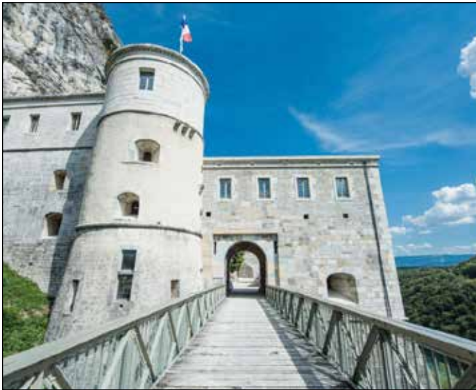
Le Fort l'Ecluse.

Pour sa première édition, le Festival Electro'Fort s'installe au mythique Fort l'Ecluse, perché à flanc de montagne avec une vue imprenable sur les Alpes et la vallée du Rhône. Les spectateurs auront la chance de pouvoir profiter de la musique électronique dans ce cadre grandiose. Situé à la route de Genève, à Léaz en France, le Festival débutera le samedi 23 septembre 2023 à 16h (les portes ouvriront 30 minutes avant), jusqu'au dimanche 24 septembre 2023 à 4h du matin. Douze heures de musique non-stop, l'occasion de danser toute la nuit!